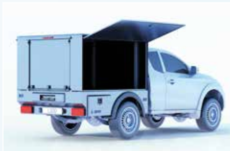
› Gasfedergestützte und abschließbare Klappe