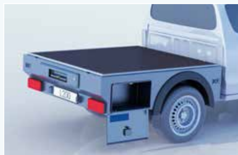
› Werkzeugkiste (B 550 mm x H 300 mm x T 250 mm)