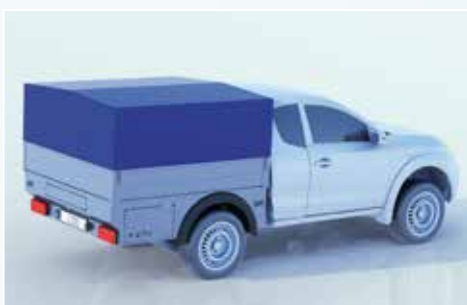
› Plane- und Spriegelaufbau