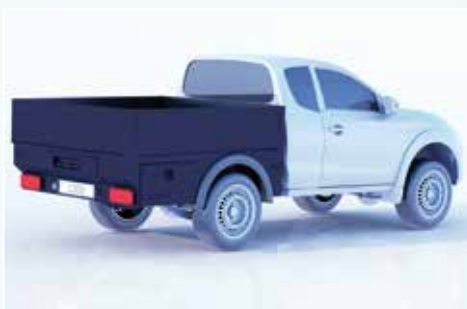
› Lackierung / Pulverbeschichtung