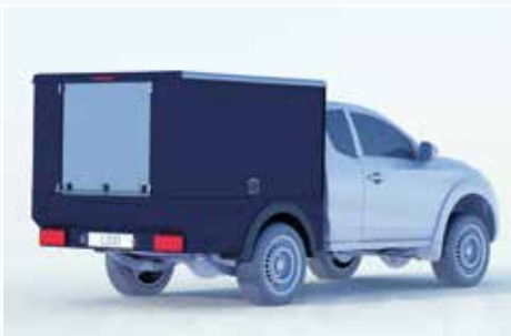
› Lackierung / Pulverbeschichtung