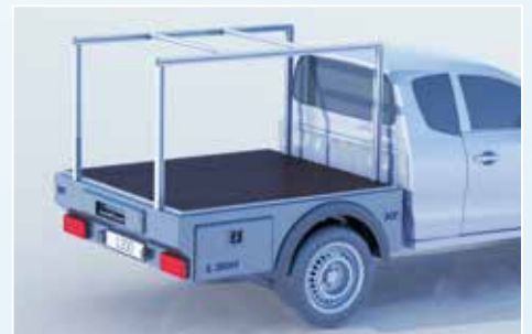
› Aluminium-Systemprofil für Schnellmontage