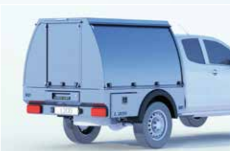
› Abgerundeter Systemkoffer