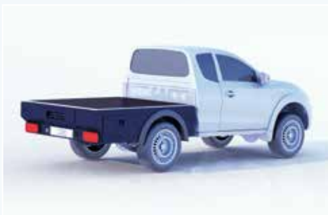
› Lackierung / Pulverbeschichtung