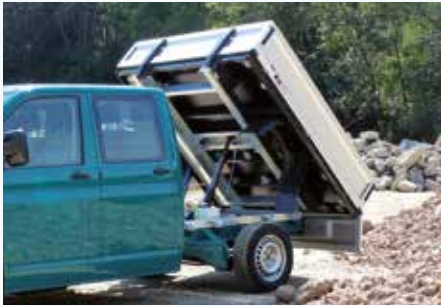
› Umbausatz Hinterkipper