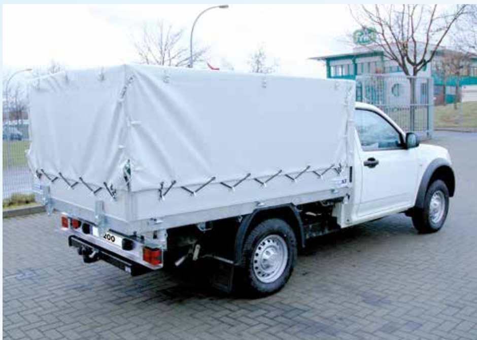
› Plane- und Spriegelaufbau