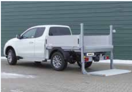
› Wechselsystem mit Ladebordwand