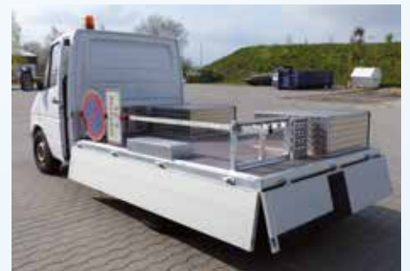
› Kommunale Lösungen