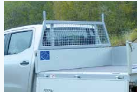
› Leiterträger - Fahrerhaus angepasst