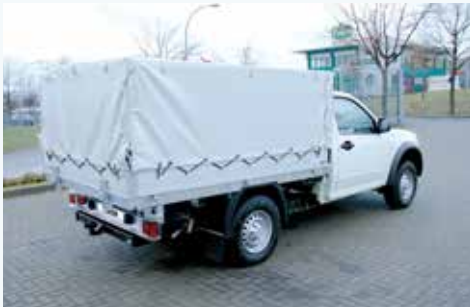
› Plane- und Spriegelaufbau